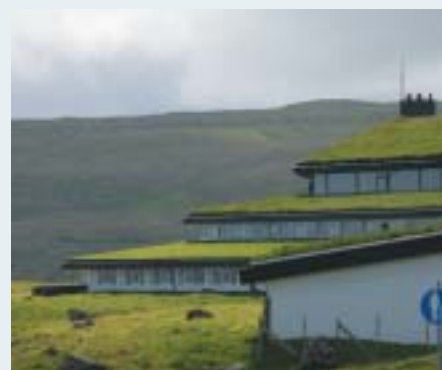
Hotel Føroyar, Torshavn.

Hotel Føroyar - kun godt 2 timers flyvning fra Danmark. Som gæst på hotellet, der ligger i udkanten af Torshavn lige ud til Atlanterhavet, er man som i en helt anden verden.