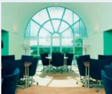
Trinity Hotel- & Konferencenter.

Central placering, suverænt omdømme, højt kvalitetsniveau og stor kapacitet er blot nogle af de ting, der kendetegner Trinity Hotel & Konferencenter i Snoghøj ved Fredericia.