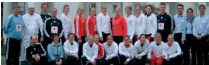
Kvindelandsholdet i håndbold på Skodsborg Kurhotel & Spa

Forud for håndbold VM i Skt. Petersborg indtog damelandsholdet Skodsborg Kurhotel & Spa i en lille uge og nød i den periode godt af stedets mange helse og spa faciliteter. Herunder også hotellets buffet, som altid er baseret på spa køkkenets sunde og næringsrige mad, bl.a. kendetegnet ved at alle animalske fedtsyrer er erstattet med de væsentligt sundere vegetabiliske fedtsyrer. Det var derfor stort set ikke nødvendigt med justeringer, for at buffetten blev om-