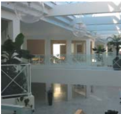
Nye faciliteter på Hotel LEGOLAND