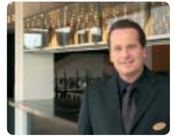
Ny Restaurant Wohlert på Schæffergården i Gentofte.

Restaurant Wohlert på Schæffergården i Gentofte ved København er blevet en regulær á la carte restaurant, så ikke alene kursus- og konferencecentrets daglige besøgende, men også oplandets lokalbefolkning kan nyde godt af et alsidigt menukort i nogle særdeles flotte omgivelser. ♦