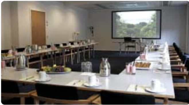
Nyrenoverede lokaler og velværemråde på Munkebjerg Hotel.

Munkebjerg Hotel ved Vejle har netop afsluttet et større renoveringsprojekt, der omfattede 6 mødelokaler og hele forplejningsområdet. Der er opsat nye lofter, lagt nye tæpper i lokalene, sort skifergulv i gangarealer og isat nye døre og vinduer i alle lokaler samt installeret elektroniske klimaanlæg og topmoderne AV/IT-udstyr. Derudover er hotellets velværemråde blevet istandsat og moderniseret - bl.a. med et fantastisk flot svømmebassin med modstrømsanlæg, mosaikoverflader på vægge og søjler, to nye spabade, et dampbad, nye omklædningsrum med sauna og solarium samt et stort relax- og fitnessområde med nye moderne massage- og hvilestole, professionelle fitnessmaskiner, behandlerrum m.v. I alt små 600 m 2 ren velvære. ♦