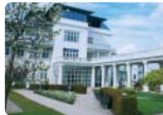
Den Grønne Nøgle til Skodsborg Kurhotel & Spa.

Skodsborg Kurhotel & Spa lidt nord for København har modtaget Den Grønne Nøgle, som er kursus- og konferencegæsters garanti for, at de har valgt et hotel, kursus- og konferencested og/eller en restaurant af høj kvalitet, hvor man har taget en beslutning om at tage hensyn til miljøet. ♦